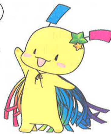
狭山市 セタの妖精 おりぴい